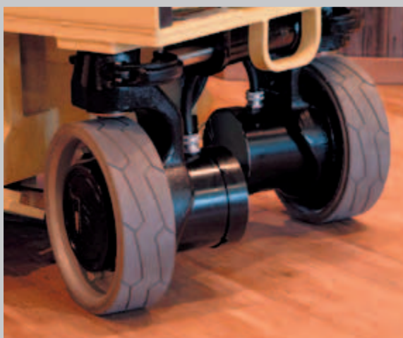
Tutti i modelli di piattaforme aeree a pantografo serie ES hanno la trasmissione elettrica diretta e una batteria a lunga durata

L'efficiente trasmissione elettrica della Serie ES permette un numero di cicli superiore rispetto a qualsiasi altra piattaforma a pantografo in commercio. A questi cicli di lavoro effettivamente più lunghi si aggiunge un sistema di ricarica rapida che consente di tenere in funzione più a lungo la piattaforma a pantografo serie ES durante la giornata di lavoro.