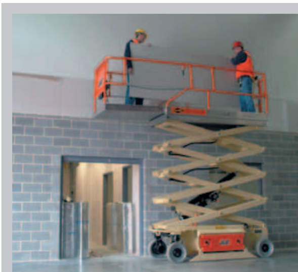
Piattaforme più grandi e portate superiori

Mai in precedenza una serie di piattaforme a pantografo elettriche aveva offerto tanta potenza e versatilità per impieghi all'interno e all'esterno.