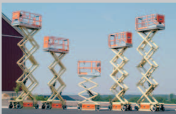
La gamma delle Piattaforme a pantografo serie ES comprende cinque modelli con altezze di lavoro comprese tra i 7,7 m e gli 11,6 m

Con lo stile moderno, l'integrazione dei componenti principali in singoli gruppi, la piattaforma antiscivolo, le estensioni e i corrimano ripiegabili, le piattaforme a pantografo della Serie ES rappresentano il nuovo riferimento del settore per prestazioni e costi d'esercizio.