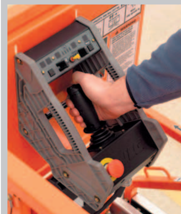
Comando completamente proporzionale delle funzioni di marcia e sollevamento

Sperimentate i vantaggi dei tempi di ricarica ridotti e dei tempi di funzionamento più lunghi con le piattaforme a pantografo della Serie ES. Tutte le piattaforme elettriche a pantografo JLG della Serie ES sono dotate di un sistema di trasmissione elettrica diretta super-efficiente che assicura cicli di lavoro ai