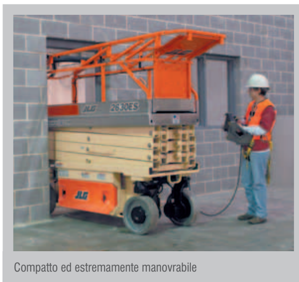
Compatto ed estremamente manovrabile

La trasmissione elettrica contribuisce inoltre a garantire un funzionamento più silenzioso nei luoghi più sensibili ai rumori e per impieghi in edifici ad uso uffici, gallerie commerciali, musei e scuole.