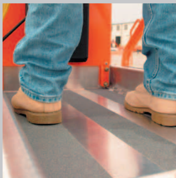
Realizzata in alluminio anticorrosione di elevata qualità, la piattaforma è dotata di strisce antiscivolo che contribuiscono alla stabilità e sicurezza dell'operatore

Una postazione di controllo migliorata permette di azionare comodamente i comandi con una sola mano, mentre l'accurato progetto dell'integrazione dei principali componenti in gruppi singoli contribuisce a ridurre le esigenze di manutenzione e i costi d'esercizio. Con due soli tubi flessibili e quattro guarnizioni, lavorerete con una macchina più pulita che riduce le esigenze di manutenzione programmata e i rischi di perdite.